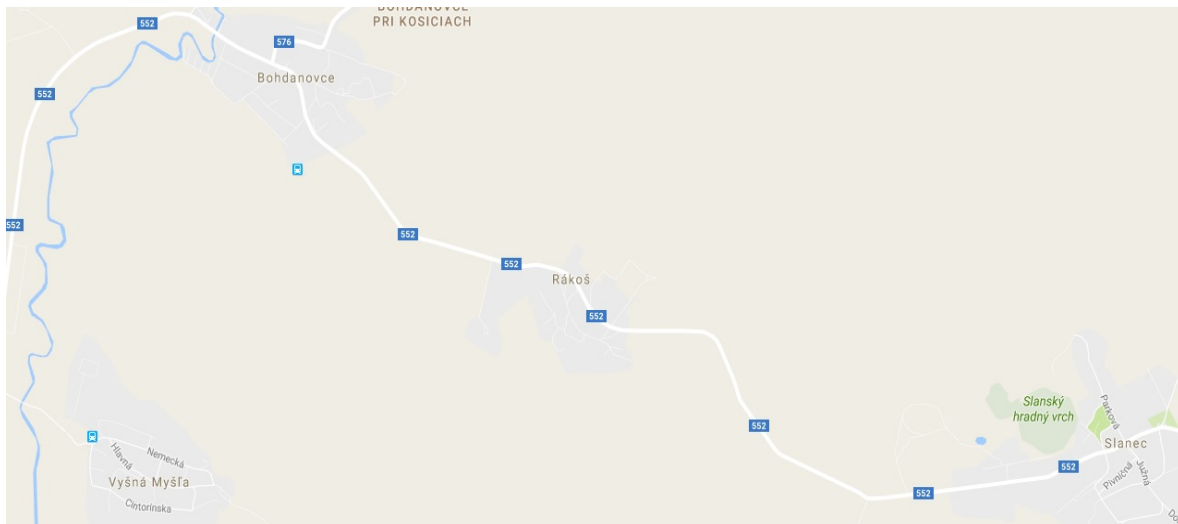
Obrázok 1 Mapa polohy obce Rákoš

Obec Rákoš sa nachádza v Košickom kraji v juhovýchodnej časti okresu Košice – okolie. Kataster obce leží v južnej časti Slanských vrchov v odlesnenej eróznej kotline. Obcou prechádza cesta II. triedy číslo 552, ktorá je spojnicou z Košíc smerom na Zemplín a Tokaj. Podnebie je mierne vlhké a mierne teplé.