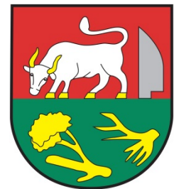
Obrázok 2 Erb obce

Erb obce Rákoš tvorí v červenom štíte na vysokej zelenej, zlatým spíleným listnatým stromom a jeho zlatými oddelenými koreňmi prekrytej pažiti pasúci sa strieborný vôl v zlatej zbroji vľavo strieborný obrátený lemeš.